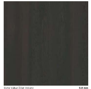
Eiche Vulkan | Oak Volcano 0,6 mm