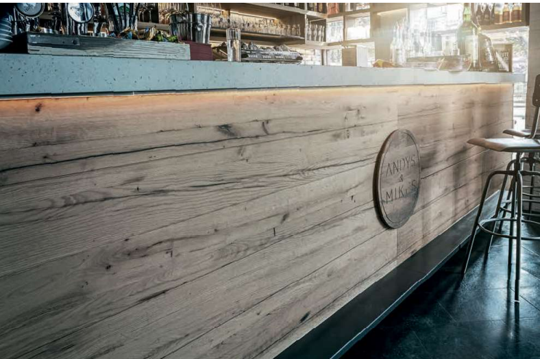
Eiche Altholz | Historic Oak

Die Vielfalt der Eiche | Diversity of oak