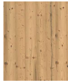
Fichte Altholz | Historic Spruce