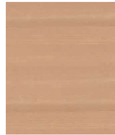
Douglasie Europäisch | European Douglas Fir