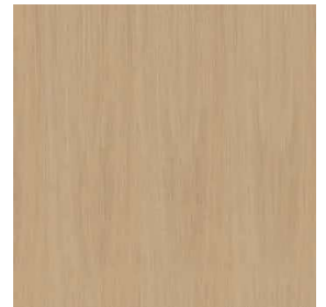
Eiche Ritt | Oak Ritt 0,6 mm