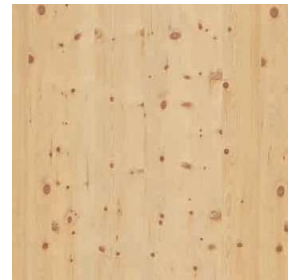
Zirbe | Swiss Pine