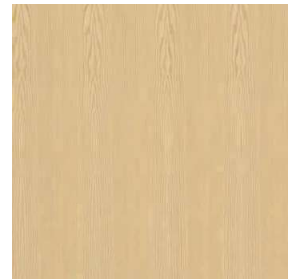
Kiefer | Pine