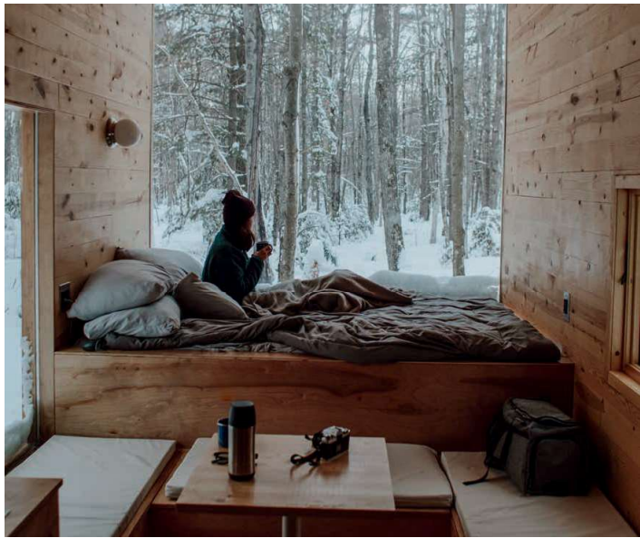
Fichte Altholz | Historic Spruce