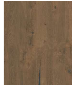
Eiche Antik | Antique Oak 0,9 mm